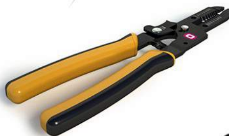
pelado de cubierta