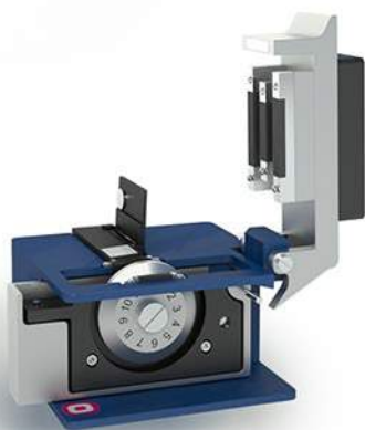
herramienta corte de precisión